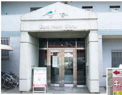
ぴあタウンたま入口