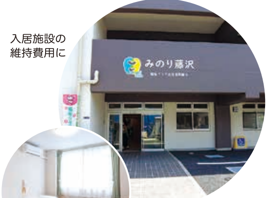
入居施設の 維持費用に