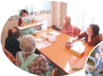
デイサービスの 設備改修

福祉クラブ生協には3つの入居施設をはじめ、デイサービスや保育 室、食事サービスの厨房など、さまざまな福祉サービスを展開する施 設・設備があります。その建設や改修工事・維持などに、組合員から寄 せられる 福祉事業会費(100円のチカラ) が使われます。一番最近で は、入居施設を含む「みのり藤沢」の建設費用に使われました。(高橋)