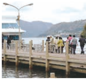
箱根リフレッシュツアー

世話焼きW・Co「さざんか」は、日常の活動は初山センターが主にあります。配達時に組合員から福祉サービス利用の相談を受けると希望のサービスにつなげ、「ぴあタウンたま」で情報共有をするなど、多摩区の要のW・Coです。