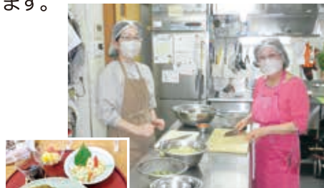
味も彩も盛り付けもgood! 毎回好評の食事です

今年は「Dayかしまだ」開設20周年目になります。いずれ自分たちが利用する施設を、とメンバーの想いを紡ぎ、努力しています。かつて活動していたメンバーが「Dayかしまだ」を利用しています。