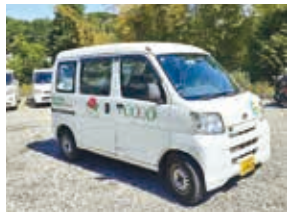
「さざんか」の宅配車

世話焼きW・Co「さざんか」は、日常の活動は初山センターが主にあります。配達時に組合員から福祉サービス利用の相談を受けると希望のサービスにつなげ、「ぴあタウンたま」で情報共有をするなど、多摩区の要のW・Coです。