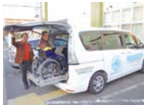
「らら・むーぶ多摩」車椅子研修

移動サービスW・Co「らら・むーぶ多摩」では、年に2回リフレッシュツアーを企画し、外出のニーズに応えています。バラの季節には、神代植物公園へ。また深大寺でのお蕎麦なども好評です。「らら・むーぶ多摩」では依頼にはできる限り応えていて、地域になくはないサービスになっています。