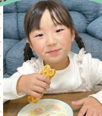
宮前区 せなさん 6歳