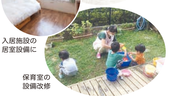
入居施設の 居室設備に