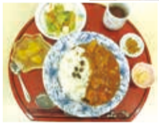
食事は施設内で手作り調理中の匂いで食欲UP

また、今後に向けては、今以上に地域に開放していきたいと力強く話していました。「まずやりたいのは料理教室」と、夢は膨らみます。地域でますます存在感を増す複合福祉施設「ポラン幸」の今後が楽しみです。