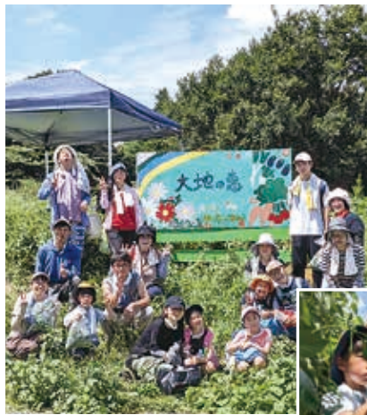
大人も子どもも夢中で収穫。 ビニール袋いっぱいのモロヘイヤを持って、大満足でした

今回はモロヘイヤと茄子の収穫でした。モロヘイヤは大人の身長よりも高く畝と畝の間に入ると隣の人の姿が見えないくらいです。新芽の5、6枚下の茎を手で折ると簡単に収穫できます。子どもも大人も夢中で収穫し、ビニール袋いっぱいモロヘイヤにみんな笑顔でした。夏場の収穫は本来、夜明け前の3時〜4時くらいに行うもの。この日は日中で汗だくの作業でしたが、子どもたちの顔は満足感いっぱい。収穫後はニッコーの消費材の「大きな豆腐肉団子」と「わたらい茶ミニたい焼き(あずき)」「モロヘイヤ餃子」をみんなで試食しました。子どもたちからは