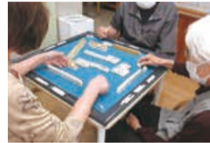
麻雀は認知症予防にも効果的

は最高齢の102歳から60歳台の後半です。一日平均は15〜16人。麻雀が大好きな利用者は、フロアの一角にある麻雀の台で、メンバーが揃うのを待っています。