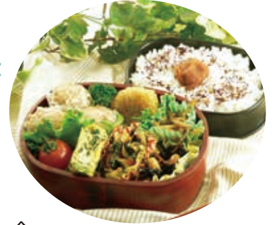
お弁当づくりも 楽しくおいしい!