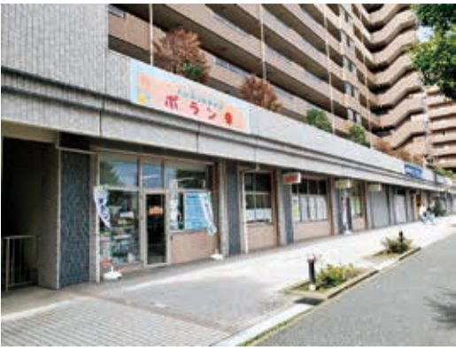
「Dayかしまだ」を改装した複合福祉施設「ポラン幸」