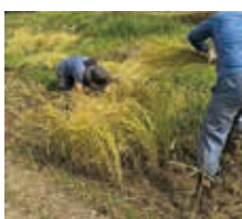
ぬかるみの中、鎌を使い手刈り作業