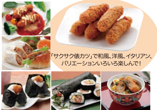
「サクサク俄カツ」で和風、洋風、イタリアン、パリエーションいろいろ楽しんで!

して食べられるものを届けたい、という想いで、お弁当や晩ご飯、軽食などの冷凍食品を作り続けています。福祉クラブのこだわりの消費材を使用し、素材の味を生かして調理しているからこそ、自然の味がしっかりと残っていて、冷めてもおいしいのが特徴です。忙しい毎日に偏りがちな食生活の方も、時短調理できる冷凍食品を取り入れながらバランスのよい食事で健康に生活していきましょう。