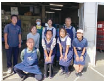
「はまゆう」多世代のメンバーが活躍中

地域住民が気軽に立ち寄れる居場所事 業として市に申請し、藤沢センターの会議 室を活用して、毎月第3木曜日に開催して います。参加者 は、取材した10 月は8人、継続 利用の方や自治 会の回覧板を見 た新規2人が参 加されました。