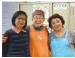
「えんじょい」のメンバー

「はまゆう」のメンバーが9人で午前・午後 とローテーションを組んでセンター事務を 担います。組合員からの電話応対を中心に、 多種多様な内容で覚える ことはたくさん。自分の入 りたい時間を調整でき、子 どもが具合の悪い時には 交代し合うなど、居心地 が良い。心配してくれて、