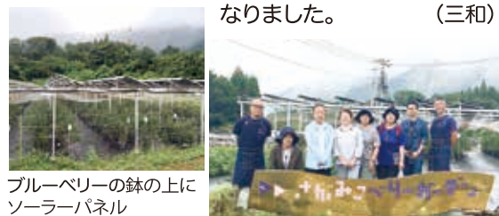
ブルーベリーの鉢の上にソーラーパネル

きっかけは東日本大震災。子どもたちに安心安全な未来を残すために「水・食料・空気・エネルギー」を自分たちの手に取り戻そうとの思いから。その実現に向けて一番重要だったのは、地域と共生すること。地域住民の中に溶け込んでいく過程をお聞きし、私たちの活動にも繋がるものがあり参考になりました。(三和)