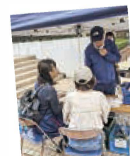
当日28名が組合員に仲間入り！

導入に充て、外出が困難な方や障がいがある方の外出支援の活動を拡げていきます。皆様のご参加、ご協力ありがとうございました。