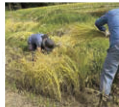
災害支援、手で稲刈り

全国各地で大雨や洪水被害、また猛暑による収穫量減少、品質の低下で流通量も減少し、米不足にも拍車がかかりました。2024年7月には、山形県庄内地方が豪雨に見舞われました。水田は広域にわたり土砂・土木流入、冠水等の被害が発生し、生活クラブ連合グループ全体130人以上が災害支援として現地に出向きました。