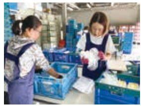
朝ワークの仕分け

1階ヤード 共同 購入の消費材の仕分け や配達。世話焼きW・Co 「はまゆう」のメンバ ーが2人一組で、配達先の ルート別に消費材の仕 分けなどの朝ワーク。 間違えないよう手早く、黙々と作業している 姿が印象的でした。2時間という短時間で、 いろいろな作業をこなします。